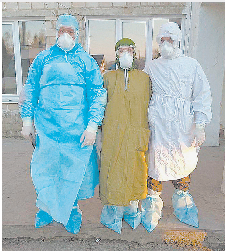
ЗМЕИНОГОРСКИЕ МЕДИКИ В НАЧАЛЕ ЭПИДЕМИИ COVID-19 Они не были обеспечены специальными защитными костюмами. Для организации безопасной работы использовались любые подручные средства.