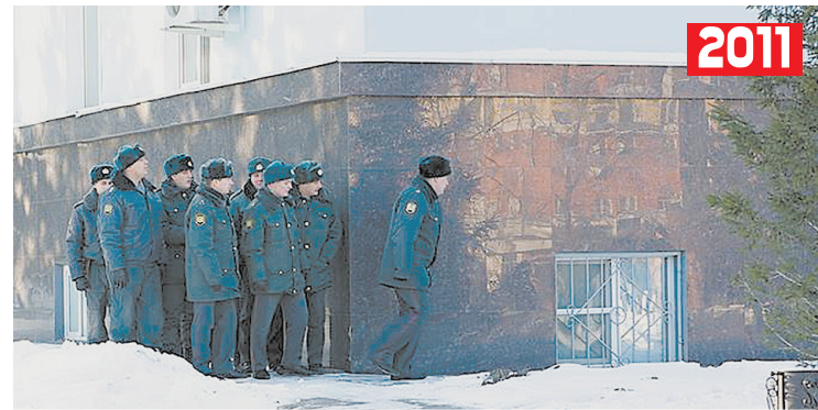
ПОЛИЦИЯ В БАРНАУЛЕ В РАЙОНЕ СТИХИЙНЫХ МИТИНГОВ В ДЕКАБРЕ 2011-ГО И ЯНВАРЕ 2021-ГО

Выходя на улицы и участвуя в выборах, мы должны выбирать тот путь возрождения страны, который не обернется очередной обдираловкой для простого человека.